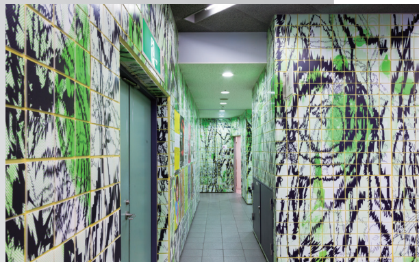
《湊旅行》川田 知志 2015 (今回は展示なし)