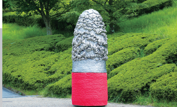
《Untitled》桑田 卓郎 2016 ©Takuro Kuwata

→その他、アーティストトークやラーニング・プログラムなど開催予定。 詳細は当館公式WEBページをご確認ください。