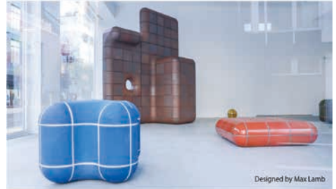
Designed by Max Lamb